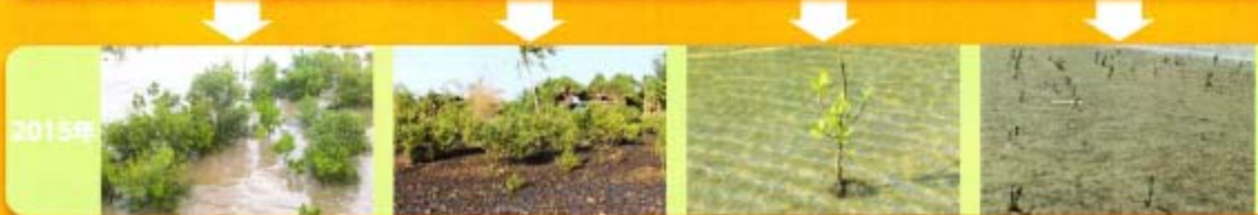
全高は約120cmにまで成長。昨年と比べ植樹は2倍程度に。