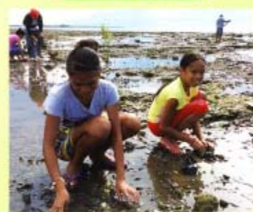
↑大きな石が崩れり穴が掘りにく在中、この日は約1,500本の苗木を植樹しました。