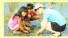
←現地の方と日本人スタッフ力を合わせて植樹を行います。