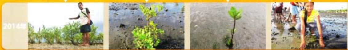
第4回(2013年)のマングローブ