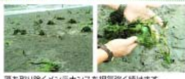
藻を取り除くメンテナンスを根気強く続けます。

苗木が波の影響を受け、大きく倒された上に、成長を妨げる藻が大量に絡まることもしばしば。しかし、これらの苗木は死滅したわけではなく、根気強いメンテナンスによって息を吹き返し、また成長できます。