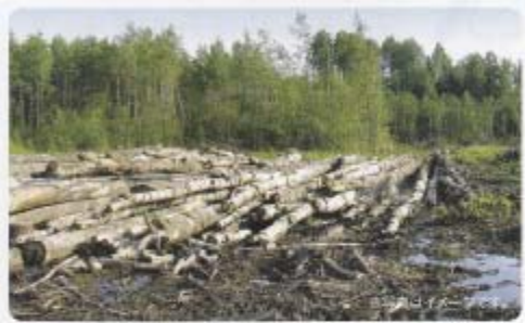
特に南アメリカやアフリカで森林破壊が行われているよ